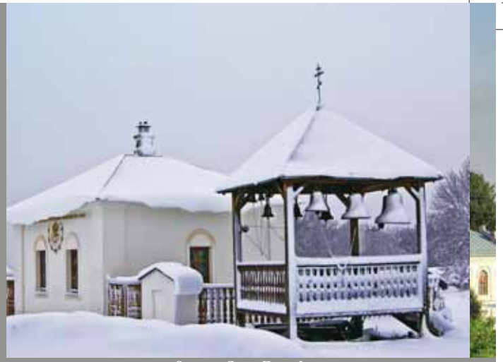
Суноево. Домик Петра I