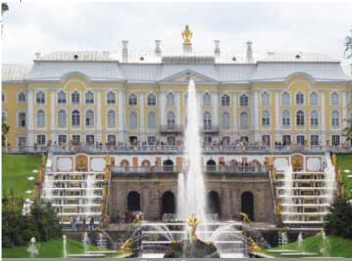
Петергоф. Большой дворец