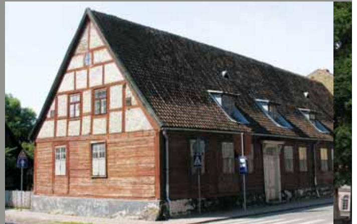
Лиелая. Дом Петра I