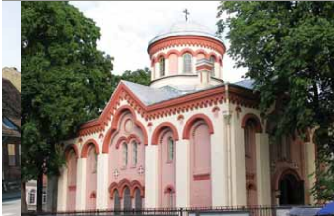
Вильнюс. Церковь Параскевы