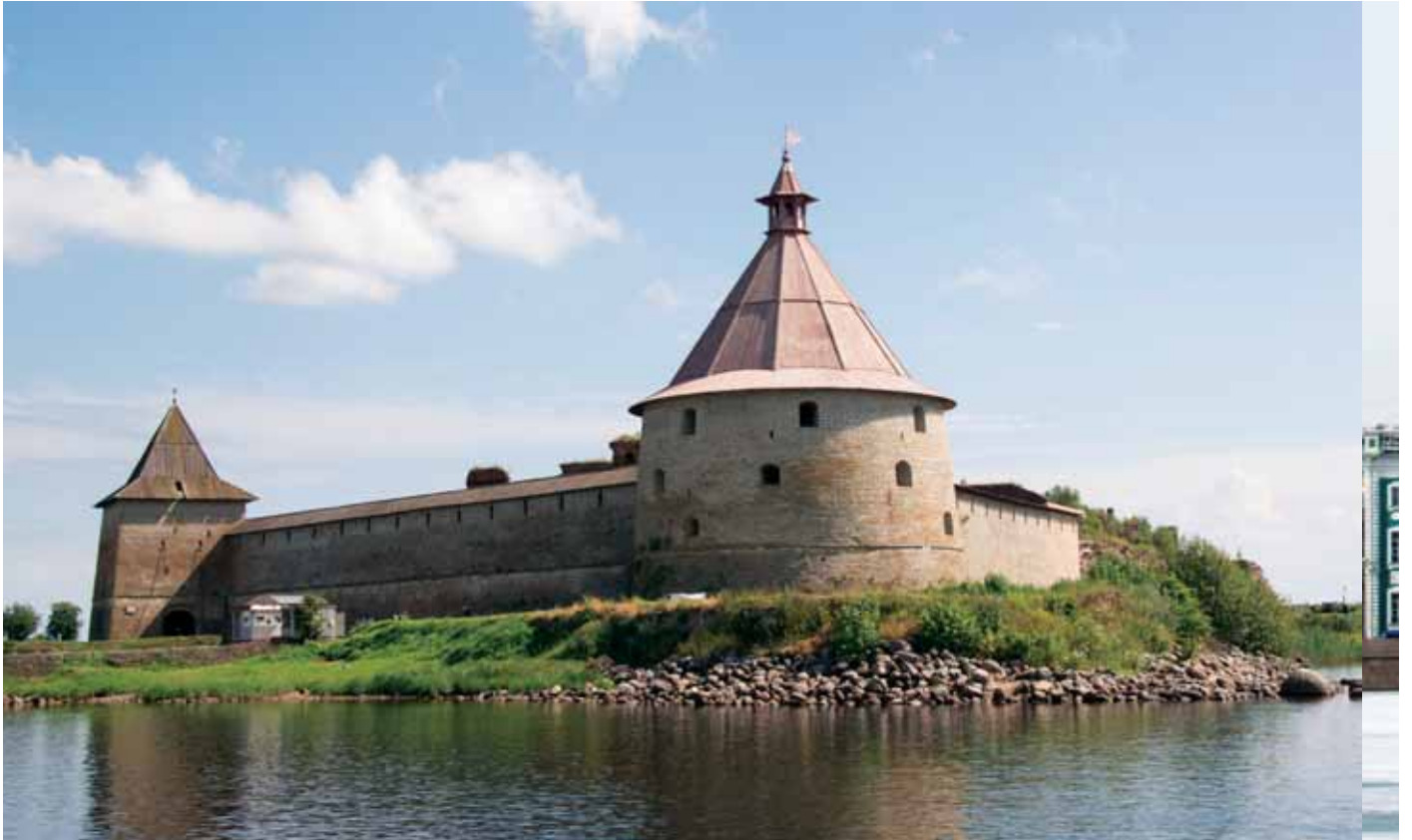
На обложке: Антуан Пэн. Портрет Петра Великого. 1716-1717. Германия. Из собрания ГМЗ «Павловск» Санкт-Петербург. Кунсткамера Шлиссельбург. Крепость Орешек