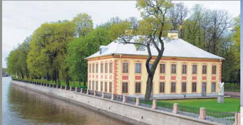
Санкт-Петербург. Летний дворец Петра I