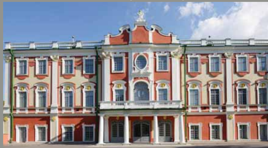
Таллин. Кадриоргский дворец