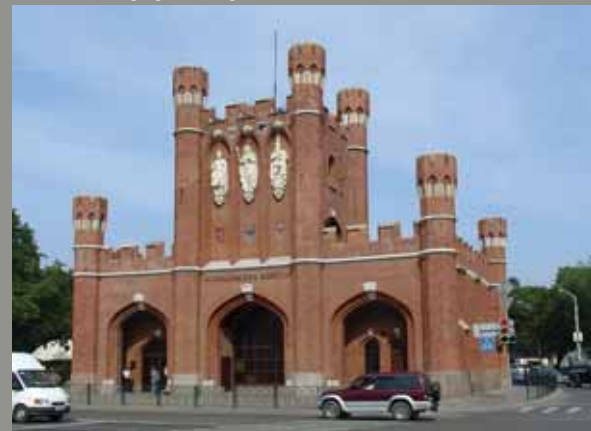
Калининград. Королевские ворота