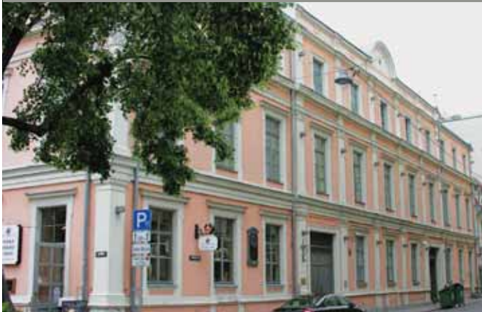
Рига. Дворец Петра I