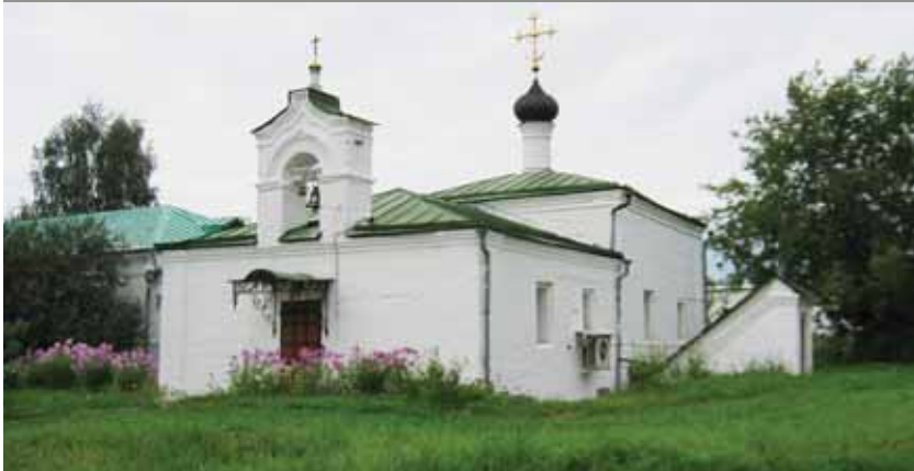
Александров. Сретенская церковь