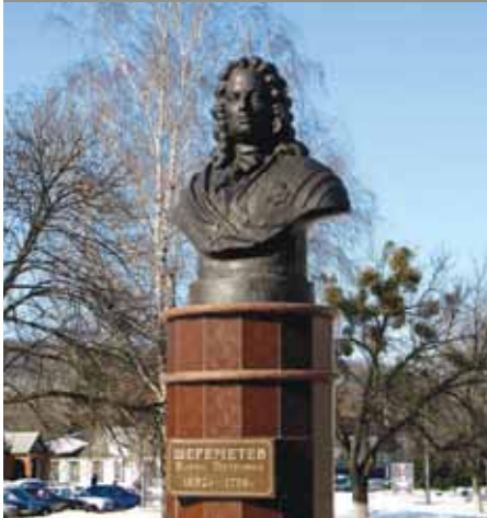
Борисовка. Бюст Б.П.Шереметева