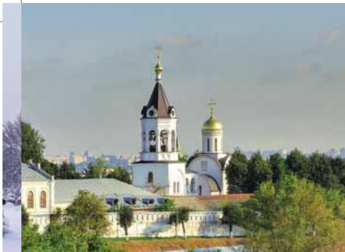
Владимир. Рождественский монастырь