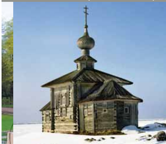
Соловки. Андреевская церковь