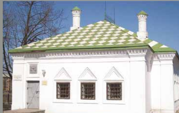
Вологда. Дом-музей Петра I