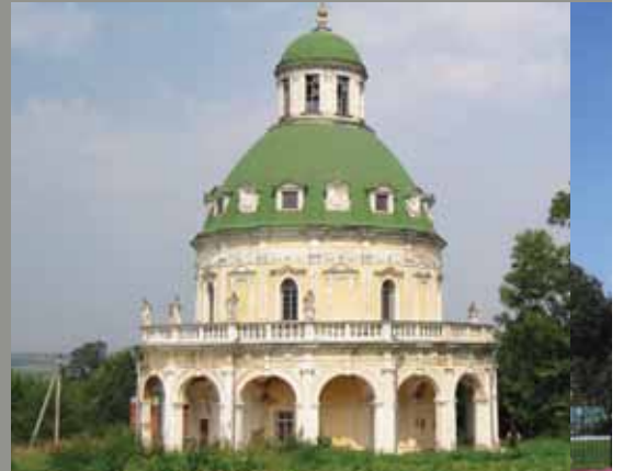
Подмоклово. Церковь в усадьбе Г.Ф.Долгорукова