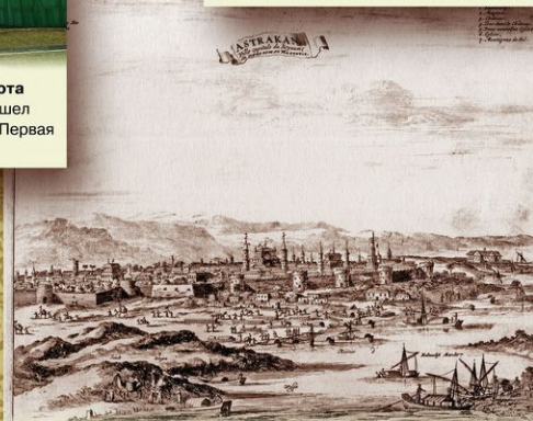
Астрахань. Иллюстрация из книги Адама Олеария «Путешествия в Московию». Издание Питера Ван дер Лейдена. 1719. Астрахань, наряду с Казанью, стала важным центром организации Персидского похода. Петр I прибыл в город 15 июня 1722. По его распоряжению и при личном участии был заложен порт.