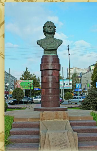
Памятник Петру I в Махачкале на проспекте Расула Гамзатова. Скульптор В. Зарипова. 2006. У подножия монумента надпись: «От благодарного дагестанского народа основателю города Петру I». В ходе Персидского похода Петр I приказал построить здесь крепость и военный порт, получивший название Порт-Петровский (с 1920 — Махачкала).