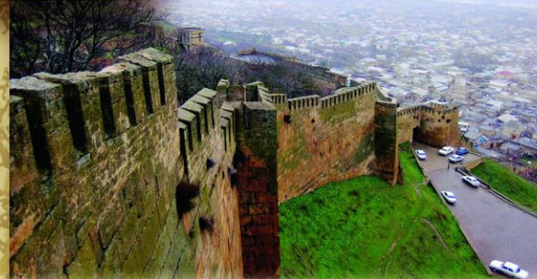
Дербент. Вид города. После сдачи Дербента были приняты меры по охране и благоустройству города. Были открыты продовольственные склады, лазареты, фабрики русских купцов. Петр I предоставил дербентцам право свободной торговли в пределах России, способствовал развитию здесь виноградарства, виноделия, шелководства.