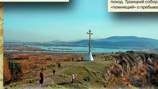
Царев Курган. Саратовская обл. Поклонный Крест. Весной 1722 Петр I, проплывая по Волге в Персию, остановился у Царева Кургана и поставил на его вершине собственноручно сделанный деревянный крест. Петровский крест не сохранился, на его месте поставлен современный высотой 15 метров.