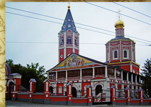
Саратов. Собор св. Живоначальной Троицы (1694—1701). Петр I посетил Саратов в июне 1722, направляясь в Персидский поход. Троицкий собор — единственный памятник в городе, «помнящий» о пребывании царя.