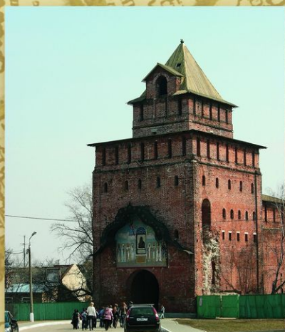
Коломна, Московская обл. Пятницкие ворота Коломенского кремля. В мае 1722 Петр I вышел из Москвы, направляясь в Персидский поход. Первая его остановка была в Коломне.