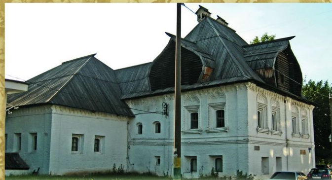
Нижний Новгород. Палаты Пушкикова. В доме нижегородского бургомистра Якова Пушкикова, по легенде, останавливался Петр I, двигаясь по Волге в Персидский поход, и праздновал здесь свой 50-летний юбилей, совпавший с 500-летием города. Это был его второй приезд в Нижний Новгород.