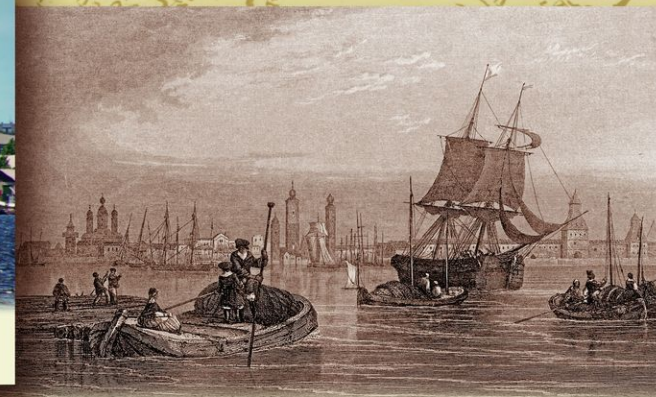
Архангельск. Гравюра. 1842. Петр I трижды приезжал в Архангельск и подолгу оставался там, наблюдая за строительством крепости и верфи. Здесь он первый раз вышел в море, отсюда отправился на Соловки. После основания Санкт-Петербурга Петр лишил Архангельский порт права вести заморскую торговлю.

СОЛНЕЧНОГОРСК * МОЛОДИ * КИЗЛЯР * ШИШЕЛЬБУРГ * МУРОМ * КОПОРЬЕ * КУПАВНА