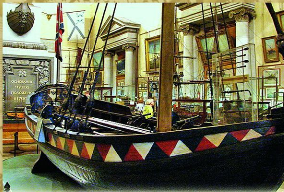
Ботик Петра I. В 1688 юный царь нашел ботик в Измайлово. Голландец мастер поставил на нем мачту и парус. Под Москвой, на реке Яузе Петр осваивал азы морского дела. 11 августа 1723 Петр на ботике произвел смотр кораблям Балтийского флота. Сейчас он находится в Военно-морском музее в Санкт-Петербурге.

Настоящее море Петр I первый раз увидел во время поездки в Архангельск. Это событие многое предопределило в истории России, дав толчок петровской мечте о море и подлинному культу корабля, прошедшему через всю жизнь царя. Во время Великого посольства царь учился кораблестроению в Англии и Голландии. При Петре в России были заложены десятки верфей и адмиралтейства, построены сотни кораблей, основаны навигацкая школа и Морская академия, создан военный флот, одержавший немало славных побед.