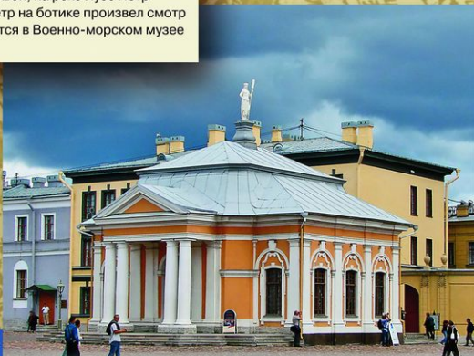
Санкт-Петербург. «Ботный домик» в Петропавловской крепости. В 1701—1722 ботик Петра I хранился в Московском Кремле, в 1723 доставлен в Санкт-Петербург, где был торжественно встречен как «дедушка русского флота». С 1723 хранился в Кронверке Петропавловской крепости, в 1766 для него был построен специальный павильон (арх. А. Ф. Вист). Сейчас в павильоне представлена точная копия ботика.