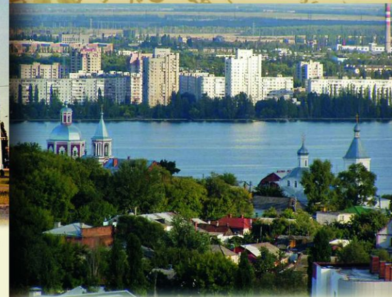
Воронеж. Современный вид. Петр I бывал в Воронеже 13 раз, проводя в городе более 500 дней. На воронежских верфях до 1711, когда по условиям Прутского мира Россия потеряла выход в Азовское море и южный флот, было построено более 200 кораблей.