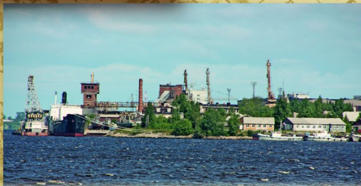
Архангельск. Остров Соломбала. Во время визита в Архангельск в 1693 Петр I отдал распоряжение о строительстве на острове Соломбала первой государственной верфи. Соломбальская верфь работает уже более 300 лет.