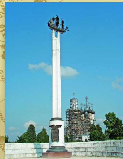
Дединово, Московская обл. Обелиск в память о сооружении первого российского военного корабля. Петр не раз посещал верфи дворцового села Дединова. Здесь в 1667 был спущен на воду первый в России военный корабль «Орел», модель которого венчает памятный обелиск.