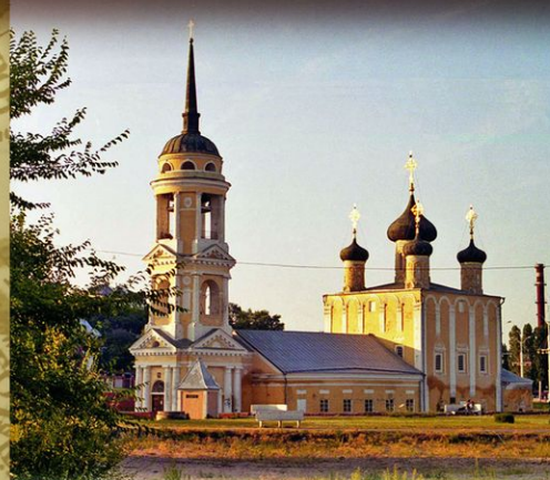
Воронеж. Успенская (Адмиралтейская) церковь (1694—1703). Успенская церковь была превращена Петром I в главную церковь Адмиралтейства. Здесь воронежский епископ Митрофан освятил Андреевский флаг, ставший символом отечественного флота. По легенде, иногда на клиросе пел сам Петр I.